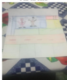
Imagen 18 "Paz en casa"

Dibujo de Diego Porras, persona con discapacidad cognitiva. El dibujo representa su casa, él junto a su madre.